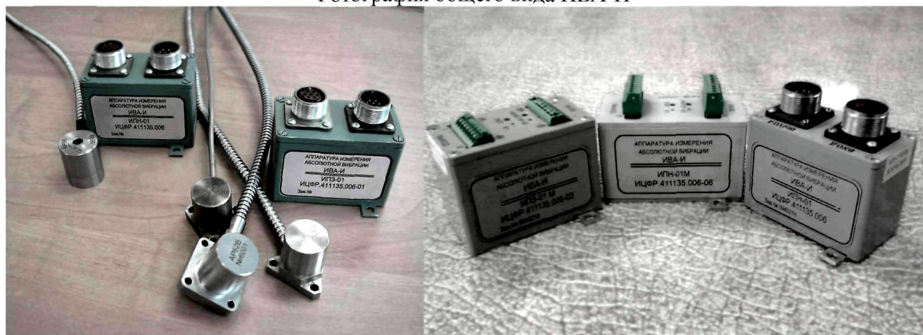
Фотография общего вида ИВА-И